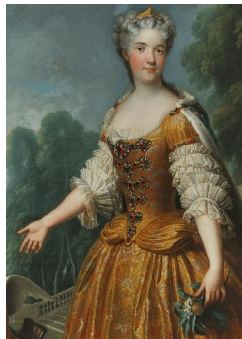
Marie LESZCZYNSKA Par François STIÉMART