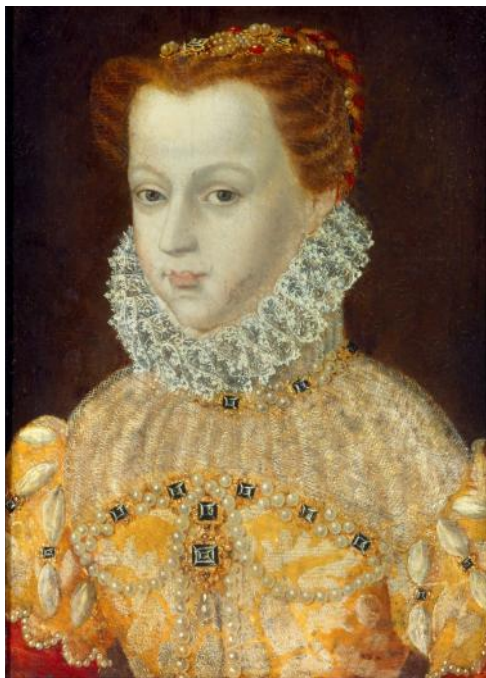
Marie STUART, Reine de France et d'Écosse Artiste inconnu

Le rendez-vous de tous les passionnés d'Art et de Culture