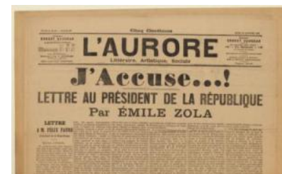
Émile ZOLA - Affaire DREYFUS Journal l'Aurore n° 87 du 13 janvier 1898

Il reste de la profusion de ces débats que l'affaire Dreyfus est le premier événement politique qui, en France, a connu une forme de surmédiatisation. À ce titre, il fait autant partie de l'histoire de France que de l'histoire de la presse.