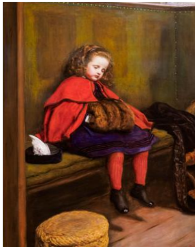
MON DEUXIÈME SERMON Par John Everett MILLAIS (1864)

Plongés dans un sommeil réparateur ou en proie au somnambulisme, enfants innocemment assoupis ou créatures de rêve alanguies, les exemples abondent et ont inspiré tous les arts, de l'Antiquité à nos jours.